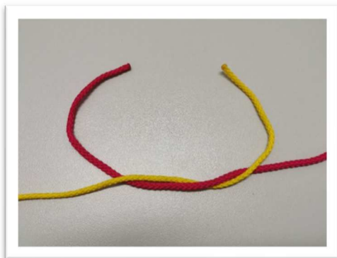
Die Seilenden nach oben nehmen. Das rechte Seil über das linke legen und...