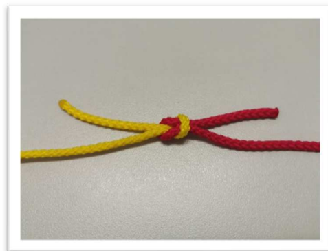
Dann nach beiden Seiten festziehen.